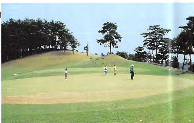
芝の張替えが完了した南11番の高麗グリーン