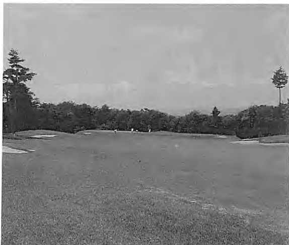
黄金コース・7番ミドルホール