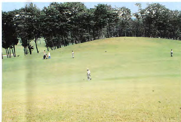
芝張替えが終了した南9番のフェアウェイ