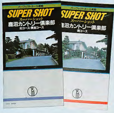
ハウス売店で販売されているコースガイドブック

公式競技あるいはプライベートコンペで栄冠を勝ち取るために、お役に立ててみてはいかがでしょうか。