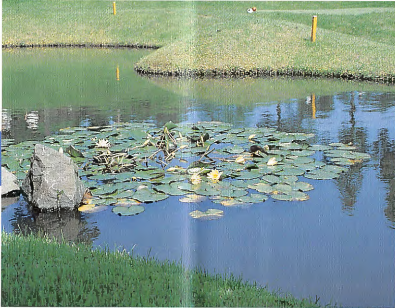
北コース、1番ミドルホール