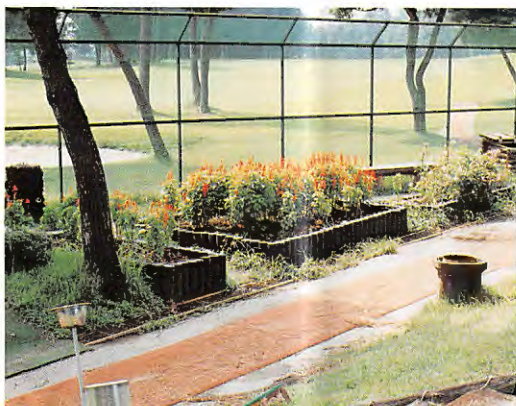
整備された北9番の花壇