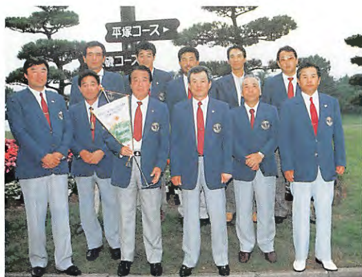
35位に甘んじた鹿沼CCチーム