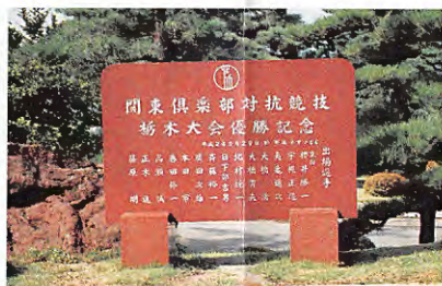
地区予選初優勝の記念碑