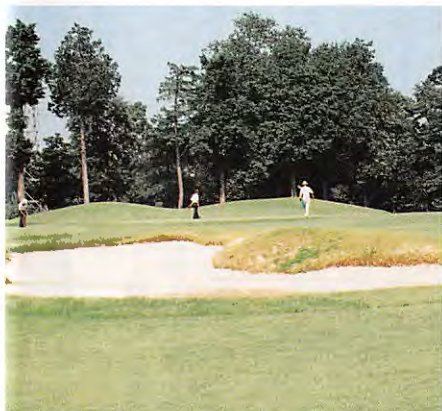
拡張された北6番ベントグリーン手前のバンカー