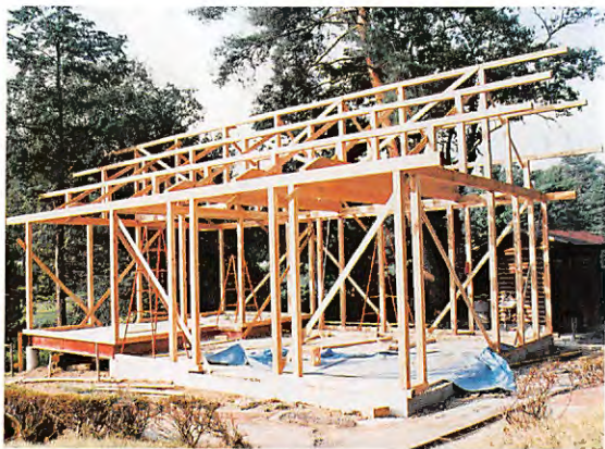
新築工事に着手した南7番の売店

完成は本年10月中旬の予定ですが、その 間、プレーヤーの皆様なるべくご不便を 掛けぬようにということから、同ホールの フルバックティエグラウンド沿いに仮売店 を設置して営業をしております。